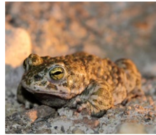
Le Crapaud calamite apprécie les mares à fond sablonneux et bien ensoleillées de la réserve naturelle.