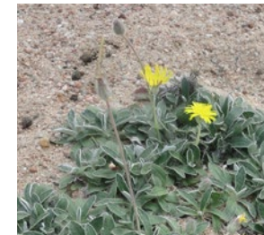
La Piloselle de Loire est une sorte de « pissenlit » qui pousse sur les pelouses sableuses régulièrement remaniées par la Loire. C'est une espèce endémique du Val de Loire et protégée en Bourgogne.

Sur la réserve naturelle, cohabitent des plantes aux exigences variées . Vu les conditions de vie changeantes, et parfois très contrastées, en lien avec la dynamique de la Loire, certaines d'entre elles peuvent survivre aux sécheresses mais aussi aux inondations !