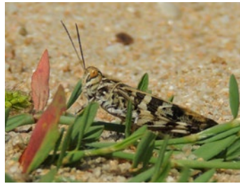
L' Cedipode soufrée affectionne les pelouses sableuses et sèches des bords de Loire. Plutôt rare dans la région, ce criquet est très présent sur la réserve naturelle.

Au sein de cet espace préservé, vivent de nombreuses espèces animales, caractéristiques aussi bien des milieux secs que des milieux humides . Elles y trouvent refuge, nourriture et sites de reproduction.