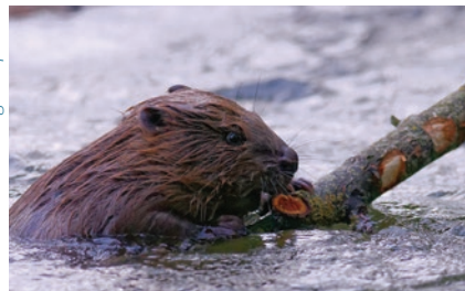
Gilbert Lienhard - regards-photos.fr