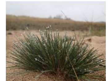
Cette « touffe d'herbe » des pelouses sableuses paraît insignifiante, pourtant c'est une espèce protégée en Bourgogne ! Il s'agit du Corynéphore blanchâtre .