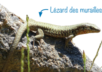
Lézard des murailles

Animer, accompagner des projets de territoire et les politiques publiques relatives à la biodiversité, l'eau et l'agriculture.