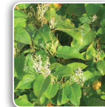
Renouée du Japon

L'Ambroisie à feuilles d'armoise est une plante pouvant atteindre 2 mètres de hauteur. Ses fleurs nombreuses, petites, vertes et de couleur jaunâtre à maturité, produisent un pollen auquel 6 à 12% de la population française serait sensible. Introduites accidentellement en France dans la seconde partie du 19 e siècle, les semences d'Ambroisie se retrouvent aujourd'hui dans les sachets de graines pour nourrir les oiseaux. Peu à peu, l'Ambroisie se répand dans les milieux naturels perturbés (bordures des cours d'eau, friches industrielles, bords de routes...), au détriment de la flore locale.