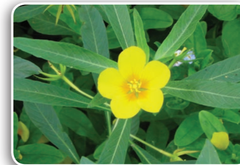
Jussie à grandes fleurs

Cette plante de 30 cm à 1 mètre de haut aurait atteint le territoire français dans des ballots de laine en provenance d'Argentine. Elle est reconnaissable à son sommet à deux épis, plus rarement trois, disposés en V. Ses fleurs produisent de nombreux fruits. Ses tiges sont couchées et ses racines fortement ancrées dans les milieux humides ou superficiellement inondés, les berges de canaux, les grèves de rivière et les marais. La présence de cette plante serait aujourd'hui très sous-estimée. Son apparition dans le Cher ou la Nièvre est à faire connaître impérativement !