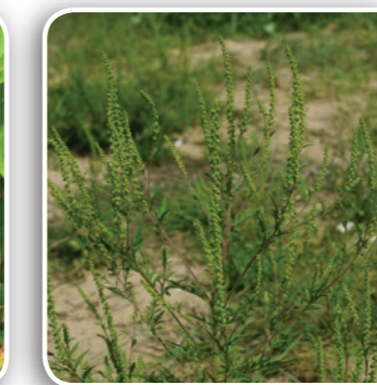
Ambroisie à feuilles d'Armoise