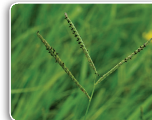
Paspale à deux épis