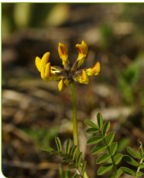
Hippocrepis fer à cheval