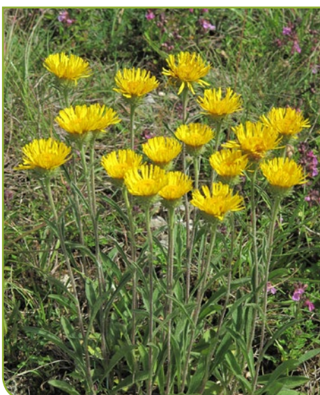
Inule des montagnes