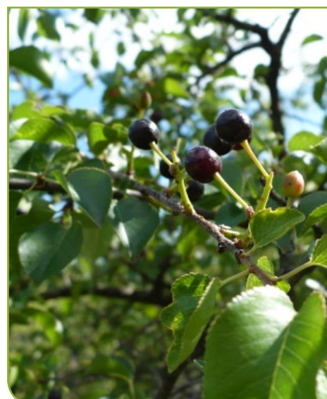
Cerisier de la Sainte-Lucie