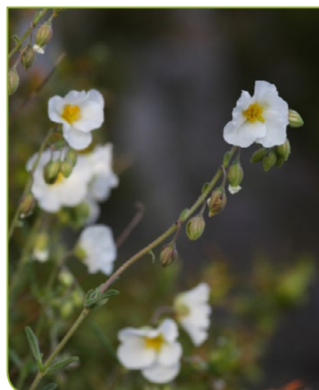
Hélianthème des Apennins