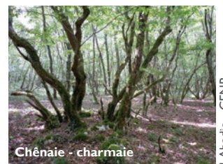
Chênaie - charmaie

Le reste de la réserve, recouvert de forêts , offre une ambiance plus ombragée.