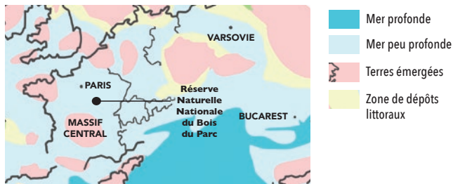
Carte de la paléogéographie d'une partie de l'Europe au Jurassique

En effet, il y a environ 160 millions d'années , au Jurassique, à l'emplacement de l'actuel département de l'Yonne, les conditions étaient réunies pour que des coraux puissent s'installer et se développer : un climat tropical et une mer chaude , peu profonde aux eaux claires.