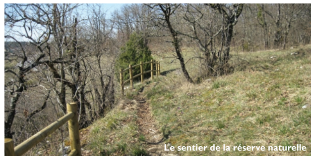
Le sentier de la réserve naturelle

Le sentier présente quelques passages à fort dénivelé rendant l'accès impossible pour les personnes à mobilité réduite. Par ailleurs, en raison de sa localisation le long des falaises, il est vivement conseillé de bien suivre le balisage.