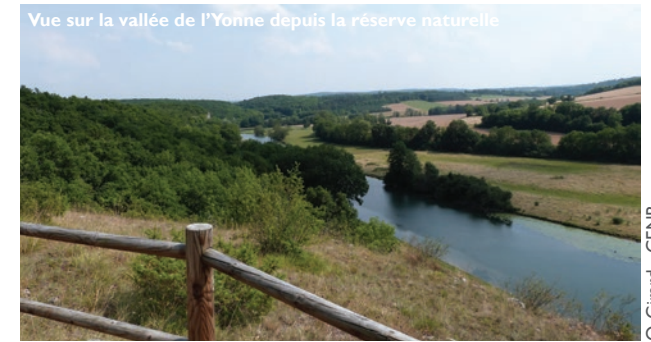
Vue sur la vallée de l'Yonne depuis la réserve naturelle

Dès le XIX e siècle, le lieu - dit « Bois du Parc » attire différents naturalistes qui attestent sa richesse biologique tant au niveau de la flore que de la faune. Puis, le patrimoine géologique de la vallée de l'Yonne commence à susciter l'attention. De nombreuses années de recherche finissent par élever son intérêt au rang national. Le 30 août 1979, afin de contrecarrer un projet d'extension de la carrière du Bois du Parc creusée pour les besoins de l'autoroute A6, le décret de création de la réserve naturelle éponyme est signé.