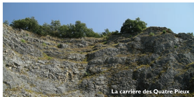
La carrière des Quatre Pieux

Localisation : Parking et carrière des Quatre Pieux