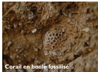
Corail en boule fossilisé

Les affleurements de la vallée de l'Yonne, et particulièrement ceux des carrières de la réserve, permettent de retracer les étapes de construction de ce récif corallien ainsi que de comprendre l'agencement de ces différentes parties les unes par rapport aux autres. Ils permettent ainsi d'observer de nombreuses colonies de coraux fossilisés en position de vie .