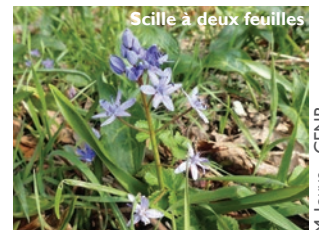
Scille à deux feuilles

Les sous-bois se parent dès le début du printemps du bleu-violet du Scille à deux feuilles avant même que les feuilles des arbres n'apparaissent.