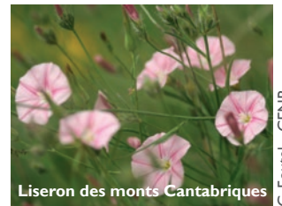
Liseron des monts Cantabriques