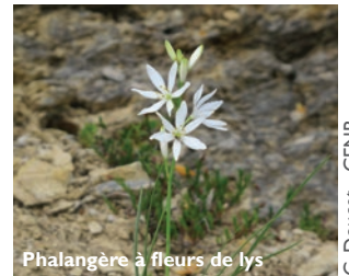
Phalangère à fleurs de lys