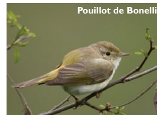
Pouillot de Bonelli

Certains passereaux comme le Pouillot de Bonelli affectionnent tout particulièrement les coteaux secs et bien ensoleillés de la réserve.