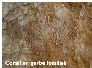
Corail en gerbe fossilisé