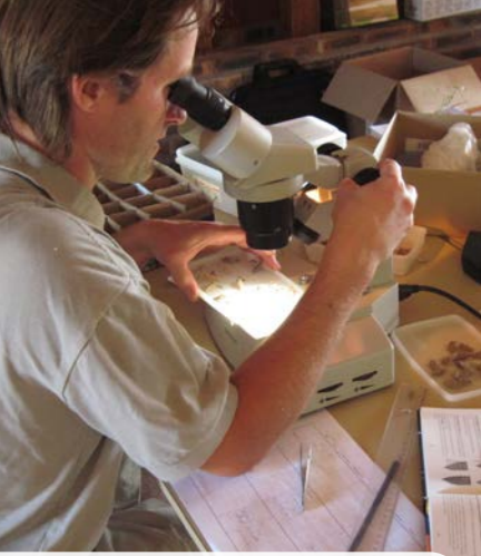
Identification de larves de libellules dans le cadre d'un suivi scientifique N. Pointecouteau - CEN Bourgogne