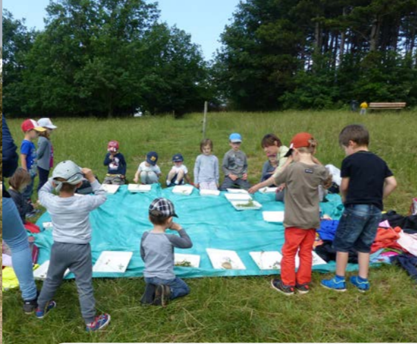
Animation scolaire sur la thématique des pelouses calcaires avec des élèves de maternelle