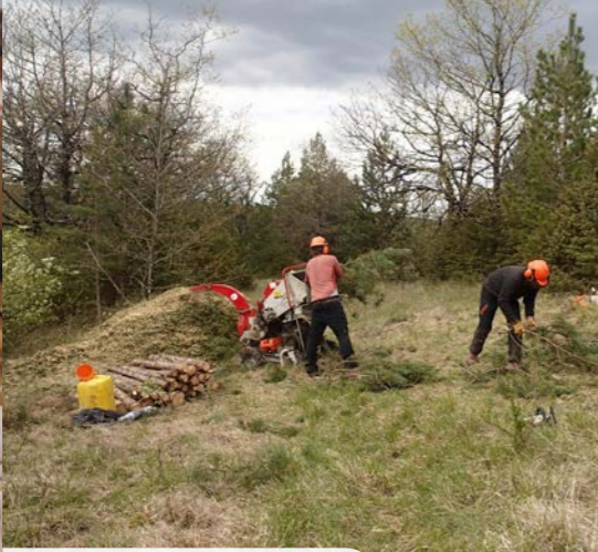
Coupe et broyage de pins pour restaurer une pelouse calcaire G. Aubert - CEN Bourgogne