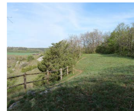
Sentier de découverte