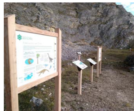
Aménagement dans la carrière des 4 pieux