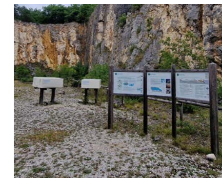
Aménagement dans la carrière de Bois du Parc